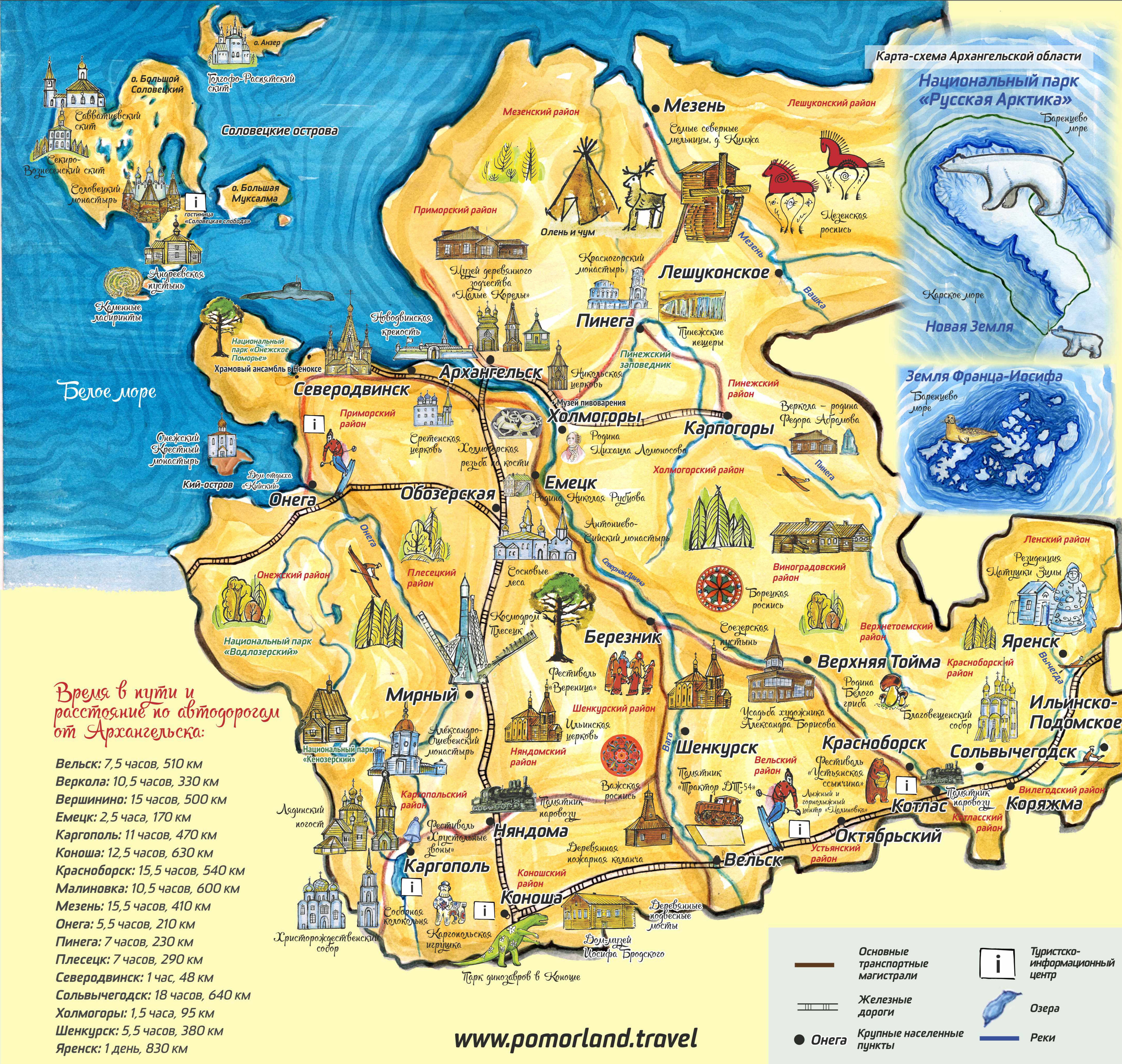
Карта-схема Архангельской области